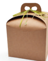
Astuccio avana Panettone