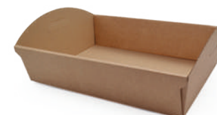
Vassoio avana grande