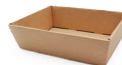
Vassoio avana piccolo