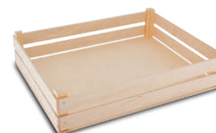
Cassettina in legno naturale