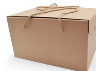
Bauletto avana grande

Via Quattro Vie, 1 25031 Torbiato di Adro (BS) +39 030 735 7154 info@polastrimaceler.it polastrimaceler.it